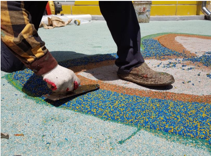
⑨달궈진 미장손으로 미장하듯 눌러주며 바닥면을 잡는다.