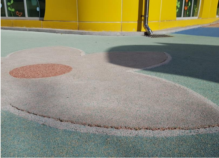
① 크랙부위 확인