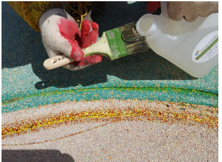
④ 포설전 시공부위 바인더 도포