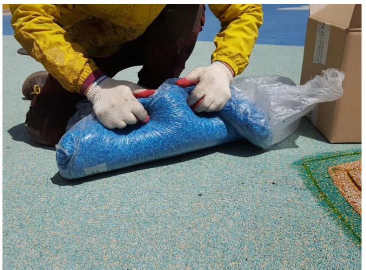
⑥ EPDM칩과 바인더혼합 (잘 버무려 주세요!!)