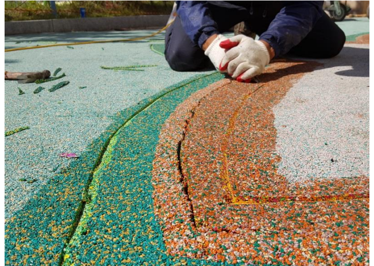
② 크랙부위 양쪽 V컷팅