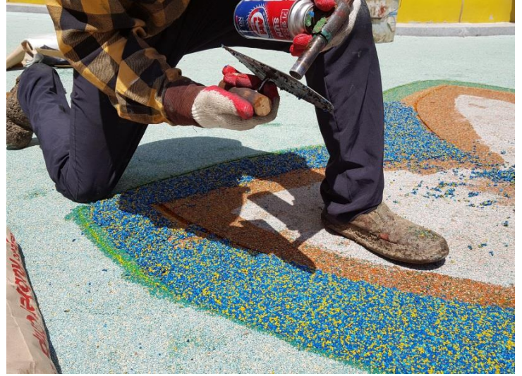
⑧미장손을 토치로 달궈줌