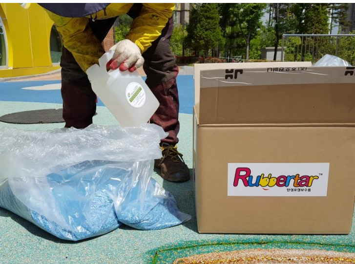
⑤ EPDM칩과 바인더혼합